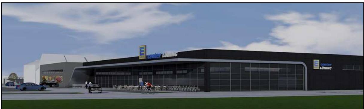
Ansicht von der Bielefelder Straße